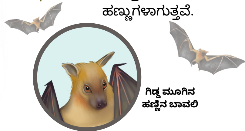
ಗಿಡ್ಡ ಮೂಗಿನ ಹಣ್ಣಿನ ಬಾವಲಿ

ಒಂದು ಪ್ರತ್ಯೇಕ ಮರದ ಜೀವನಾವಧಿಯಲ್ಲಿ ಇದು ಒಂದು ಬರಿ ಮಾತ್ರ ಹೂವನ್ನು ಬಿಡುತ್ತದೆ! ಈ ಹೂವುಗಳು ಪುಟ್ಟದಾಗಿ ಬಿಳಿ ಹಾಗೂ ಹಳದಿ ಬಣ್ಣದಲ್ಲಿದ್ದು ಗುಚ್ಚವಾಗಿ ಬಿಡುತ್ತವೆ, ನಂತರ ಅದೇ ಗುಚ್ಚದಲ್ಲಿ ಅವು ಕಡು ಕೆಂಪಾದ ಹಣ್ಣುಗಳಾಗುತ್ತವೆ.