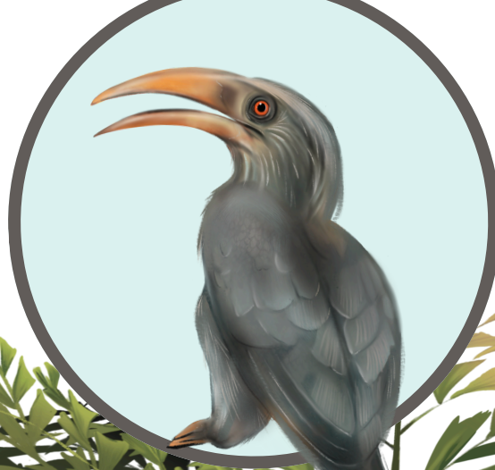
ಬೂದು ಮಲೆ ಮಂಗಟ್ಟಿ

ಈ ಅತ್ಯಾಕರ್ಷಕ ಪಕ್ಷಿಗಳು ತಮ್ಮ ದೊಡ್ಡದಾದ ಕೊಕ್ಕಿನಿಂದ ಬೈನೆ ಮರದ ರಸಭರಿತ ಹಣ್ಣುಗಳನ್ನು ತಿನ್ನಲು ಬಹಳ ಇಷ್ಟ ಪಡುತ್ತವೆ. ಅಷ್ಟೇ ಅಲ್ಲ ಕಬ್ಬಿಕ್ಕುಗಳು ಸೇರಿದಂತೆ ಉಳಿದ ಪ್ರಾಣಿಗಳ ಹಾಗೆಯೇ ಈ ಹಣ್ಣಿನ ಬೀಜಗಳನ್ನು ಹೊಸ ಹೊಸ ಪ್ರದೇಶಗಳಿಗೆ ಕೊಂಡೊಯ್ದು ಬೀಜ ಪ್ರಸರಿಸಲು ಸಹಾಯ ಮಾಡುತ್ತವೆ!