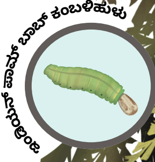
ಇಂಡಿಯನ್ ಪಾಮ್ ಬಾಬ್ ಕಂಬಳಿಹುಳು